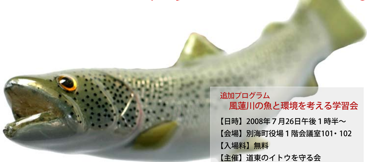
illustration : Hiroaki Fujiwara